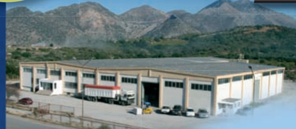
Σύγχρονες βιομηχανικές εγκαταστάσεις 4.500m 2

A3 : όνομα κατοχυρωμένο με αμετάκλητη δικαστική απόφαση